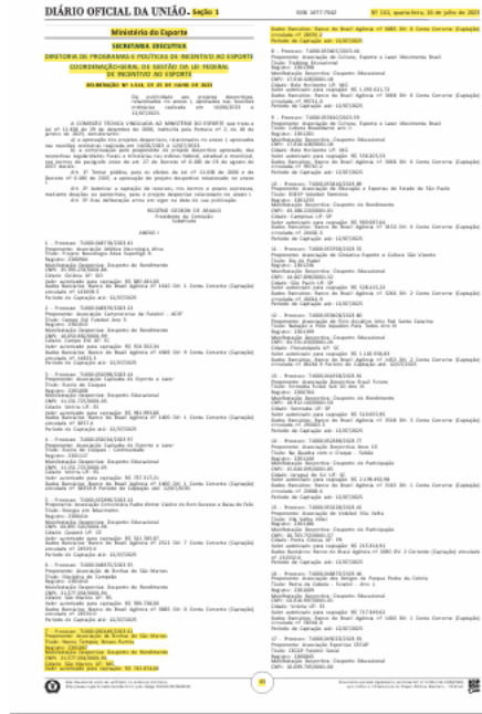
Projeto DNA de Campeão